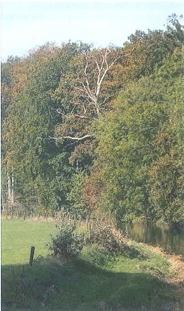
Beelden van de nieuwe brug over de Heiligenbergerbeek met natuurvriendelijke oevers aan de westzijde (linksboven) en oostzijde (rechtsboven). Links het beeld van de beek juist ten zuiden van de A28. Onder: een voorbeeld van wandelpad in een verdiepte bak langs de Kromme Rijn.