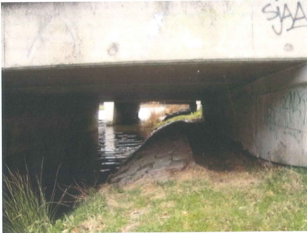
Boven: Huidige brug van de A28 over het Valleikanaal (oostzijde)

De brug moet sowieso vervangen worden in het kader van de aanpak knooppunt Hoewelaken, waarbij in het basispakket natuurvriendelijke oevers en handhaving van de bestaande fietstunnel zijn opgenomen. Geen extra kosten in de minimum variant.