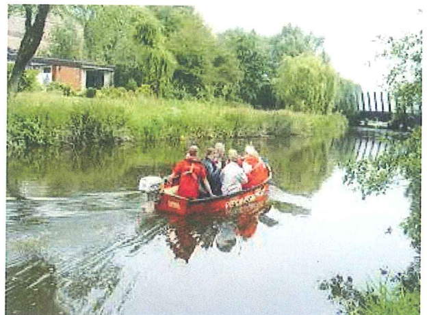
Onder: Brug over de Barneveldse beek, gezien vanaf de stad. Ter gelegenheid van Amersfoort 750 jaar bracht de reddingsbrigade wandelaars onder de brug door