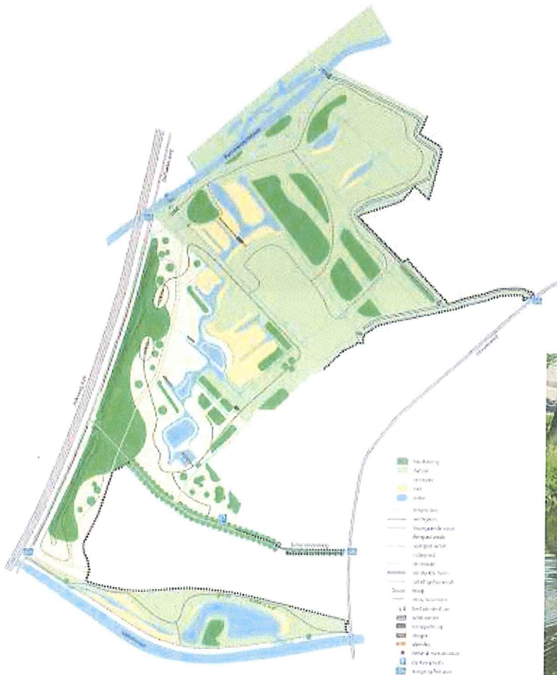
Links: Inrichtingsbeeld van De Schammer met fiets- en wandelpaden tot aan de brug van de A28 over de Barneveldse beek.

Met de aanleg van De Schammer, Bloeidaal en Stoutenburg is voor de inwoners van Amersfoort toegankelijke natuur langs de Barneveldse beek en het Valleikanaal gerealiseerd. Een fietstunnel langs het Valleikanaal heeft De Schammer bereikbaar gemaakt vanuit de stad. Het Valleikanaal is een groene verbinding geworden waarlangs natuur en mensen de weg naar de Gelderse Vallei kunnen vinden. De Barneveldse beek ligt nog altijd in een rechte betonnen bak, waardoor natuur en recreant de snelweg niet kunnen passeren. Het Waterwingebied zou via een wandel- en fietspad langs de Barneveldse beek met de Schammer en de rest van de Gelderse Vallei verbonden kunnen worden. Deze verbinding zou voor wandelaars ook de mogelijkheid openen om hele routes te lopen in het buitengebied en niet alleen langs het Valleikanaal de stad in en uit. Wij vragen u om bij de Barneveldse beek natuurvriendelijke oevers en een wandel- en fietsverbinding te laten maken. De bestaande brug staat sowieso op de nominatie om vervangen te worden bij het werk aan knooppunt Hoevelaken. De voorkeursoplossing is in een open bak, anders in een tunnel. Meerkosten ten opzichte van het standaardpakket: orde grootte 3 á 4 miljoen euro (kosten fietstunnel bij Valleikanaal).