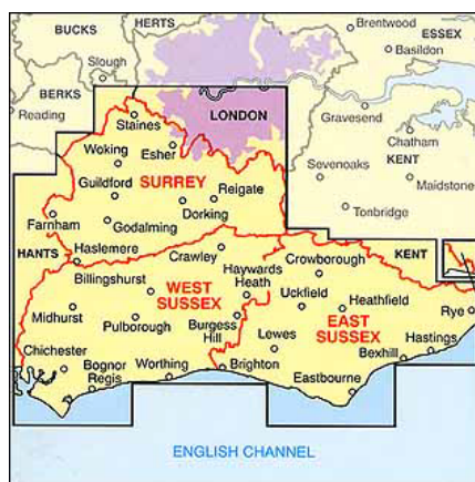
Surrey ten opzichte van Londen