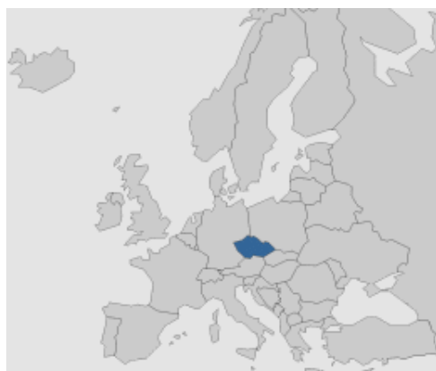
Tsjechië in Europa

Het inwonertal van de regio Zuid-Moravië is vergelijkbaar met dat van Utrecht, de oppervlakte is vier keer zo groot. De bevoegdheden, ontwikkelingen en uitdagingen van Zuid-Moravië zijn niet altijd één op één vergelijkbaar met die van Utrecht. Uit de evaluatie van het partnerschap uit 2006 2 blijkt echter dat juist in de overbrugging van de verschillen de meerwaarde van deze vriendschap schuilt. Hierdoor wordt begrip voor elkaars cultuur gekweekt. Bovendien ontwikkelt Zuid-Moravië zich zo snel dat wij inmiddels veel van hen kunnen leren. In oktober 2006 is daarom een nieuwe overeenkomst getekend.