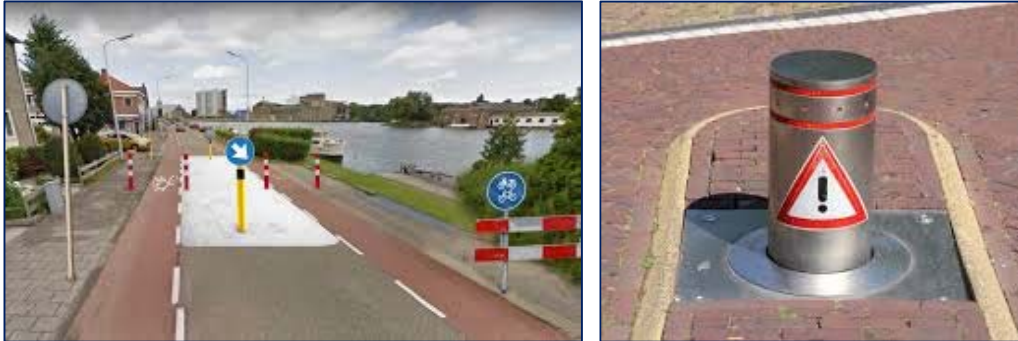
Figuur 1.10 Voorbeelden van fysieke wegafsluitingen voor autoverkeer