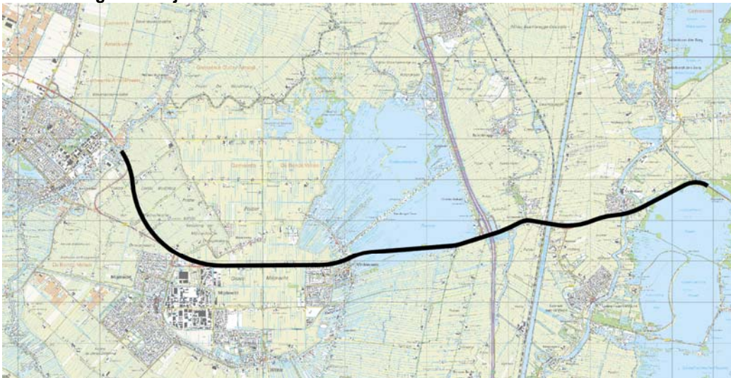
Figuur 1.5 Tracé van denkrichting 2