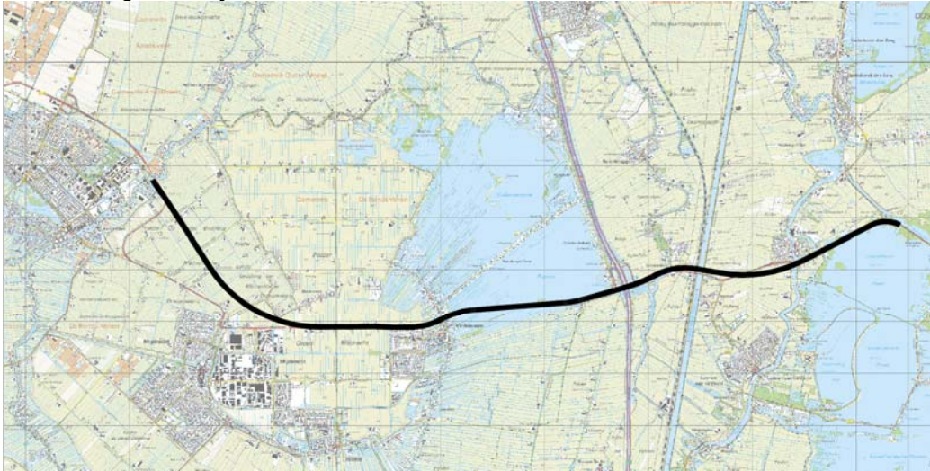
Figuur 1.2 Tracé van denkrichting 1.