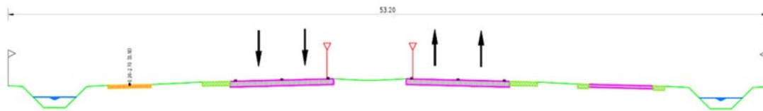
Denkrichting 2 - Principe dwarsprofiel Gebiedsontsluitingsweg wegtype I enkelbaansweg met 2x2 rijstrook Schaal 1:200