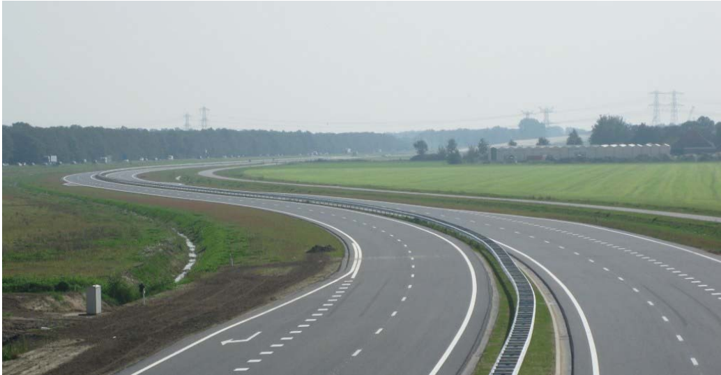
Figuur 1.4 Voorbeeld van een 2x2 autoweg (N50 Ens, bron: wegenwiki.nl)