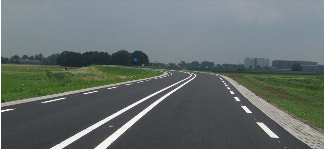
Figuur 1.8 Voorbeeld van een 1x2 weg