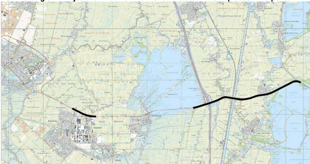
Figuur 1.7 Tracé van denkrichting 3

Op de N201 blijft de wettelijke maximum snelheid 80 km/u. De status van de weg blijft verder hetzelfde als in de huidige situatie. De S-bocht op de N201 bij Mijdrecht (Hofland) wordt gestrekt, waarbij de bochtafsnijding enkel bij Mijdrecht plaatsvindt en niet wordt doorgetrokken tot Uithoorn. Het aquaduct bij Amstelhoek blijft een rijbaan met 1x2 rijstroken. Op de kruispunten waar de N201 wordt verbreed van 1x2 rijstroken naar 2x2 rijstroken zijn alleen de rechtdoorgaande stroken op de N201 ook uitgevoerd met 2 rijstroken per rijrichting. Er is in dit stadium van het onderzoek nog niet onderzocht welke kruispuntconfiguratie (aantal rijstroken per rijrichting) bij alle kruispunten noodzakelijk is.