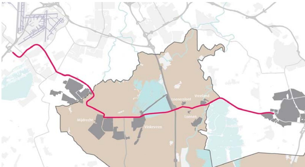
Figuur 1.1 De N201 loopt van Zandvoort tot Hilversum. Het Utrechtse deel is 16,3 kilometer lang en loopt vanaf het aquaduct bij Amstelhoek tot net voorbij Vreeland

De provinciale weg N201 kent al jaren grote doorstromingsproblemen op verschillende wegvakken. Het is daarmee een van de grootste doorstromingsknelpunten in de provincie Utrecht. Dit heeft te maken met de groei van de mobiliteit en de ruimtelijke en economische activiteiten in het invloedsgebied van deze weg. De Provincie Utrecht blijft de komende jaren inzetten op het maximaliseren van de capaciteit en doorstroming. Vandaar dat Provincie Utrecht heeft besloten om het programma 'Toekomst N201' op te starten. Dit om de toekomstbestendigheid van de N201 te onderzoeken en alle toekomstige en al lopende projecten te coördineren vanuit het programma.