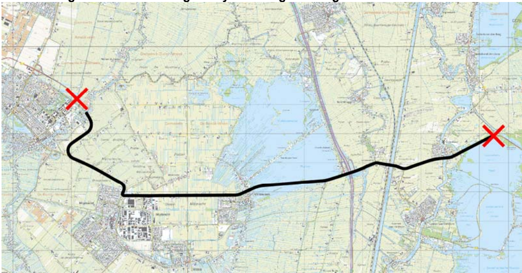
Figuur 1.9 Tracé van denkrichting 4

In denkrichting 4 blijft de N201 1x2 rijstroken houden. De enige aanpassing is dat de N201 fysiek wordt afgesloten bij het aquaduct Amstelhoek en tussen de N523 en Kortenhoef. Bij deze wegafsluitingen (zogenaamde 'knippen') kan het wegverkeer niet doorrijden. De status van de weg blijft verder hetzelfde als in de huidige situatie. De locaties van de 'knippen' zijn gekozen in de buurt van de provinciale grenzen. Op het oostelijke deel van de N201 is de 'knip' echter dichterbij Hilversum geplaatst om de verbinding met de N523 richting de A2 in stand te houden.