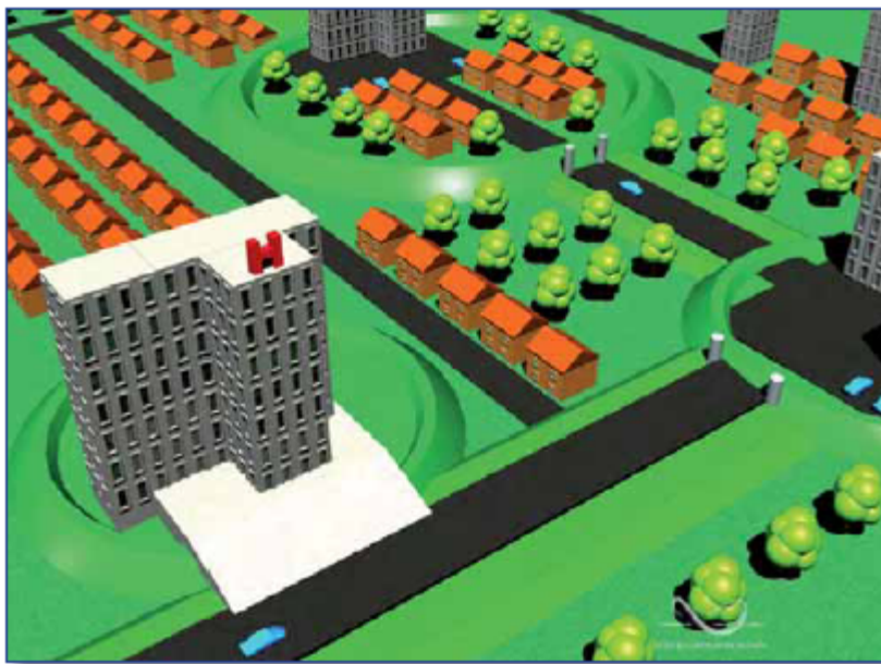
De handreiking geeft diverse voorbeelden van overstromingsrobuust inrichten. Op kleine schaal compartimenteren is er één van.