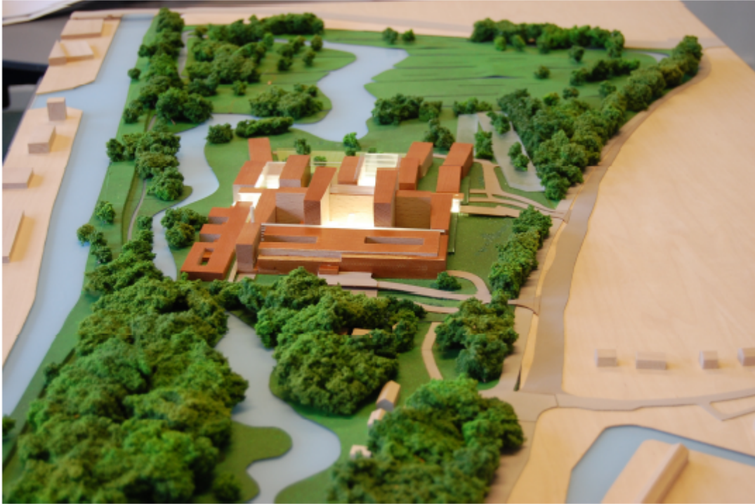
Ontwerp meander medisch centrum te Amersfoort. Het hoofdgebouw en de toegangswegen worden verhoogd aangelegd.