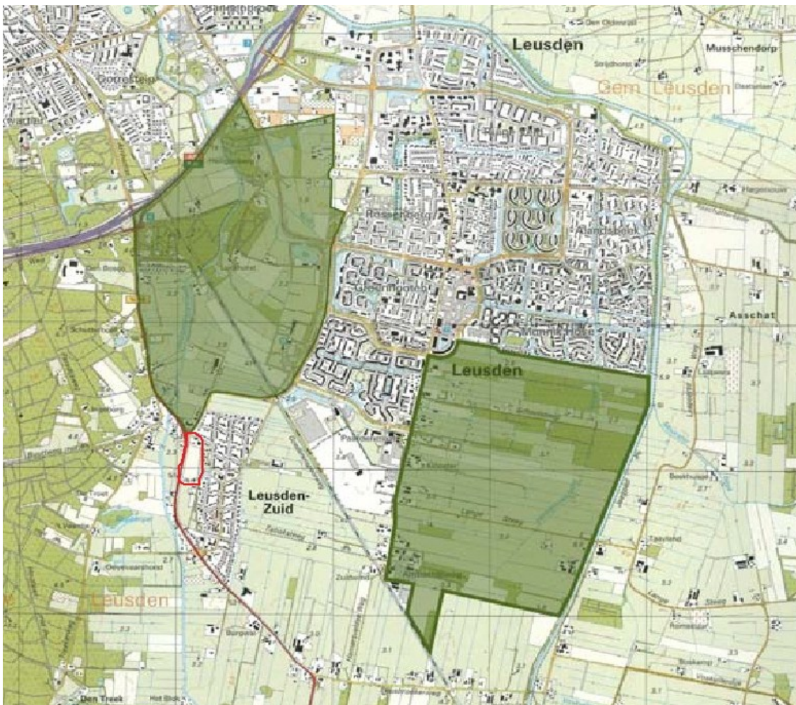
Op boven kaartje is het grasland in rood aangegeven.

Zoals gezegd, het grasland grenst aan het Centrale Buitengebied uit het Convenant Groene Agenda Leusden, een convenant gesloten in december 2008 waarin ook de Provincie Utrecht deelneemt.