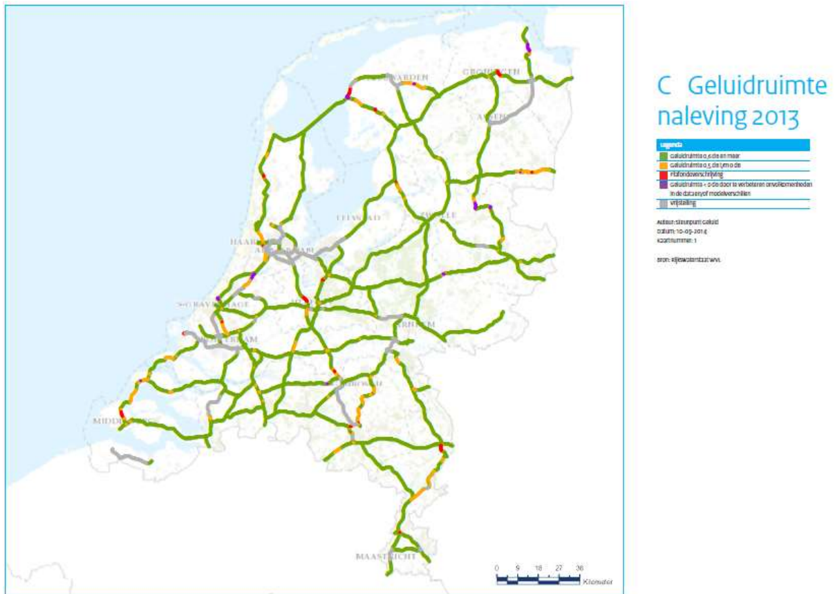
M.2014.1313 Akoestisch onderzoek snelheidsverhoging naar 130 km/h in 2015

gevulde GPP. Op grond hiervan kan ook gesteld worden dat de huidige geluidsbelasting rekening houdend met de bestaande wal circa 1 dB lager is dan hetgeen is berekend in de toekomstige situatie met de bestaande wal.