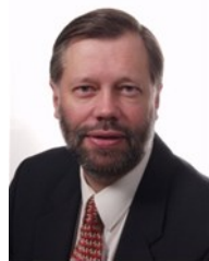
Tejo Spit Universiteit Utrecht