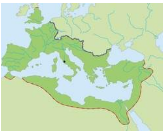
De Limes in Europa

In de opbouw van de Nedergermaanse Limes is sprake van 'antiek watermanagement': de fortenreeks beweegt mee met de zich telkens verleggende lopen van de Rijn. Die verwevenheid met het water en de specifieke lokale natuurlijke hulpbronnen maken dat het Nederlandse deel binnen het geheel van de Limes een heel specifieke positie inneemt en een wezenlijke en interessante bijdrage geeft aan de variatie die de Romeinse Limes als geheel kenmerkt