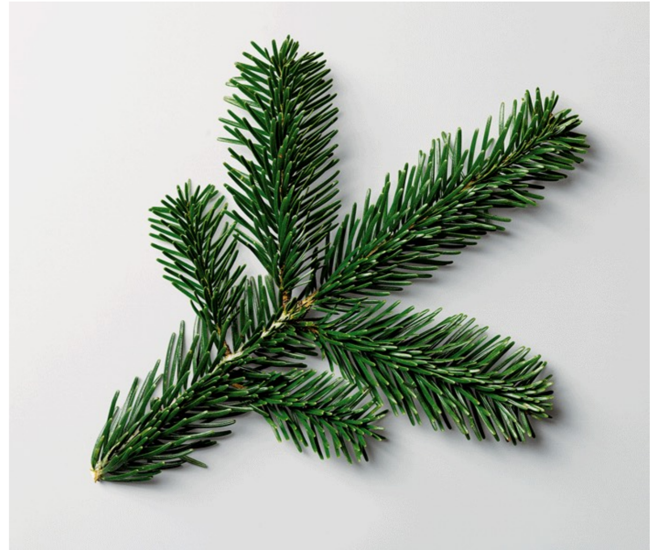
The Art Of Clean Up, Ursus Wehrli uit werkprogramma PARK 2020/2023 COMPLEXITEIT VAN OPGAVEN