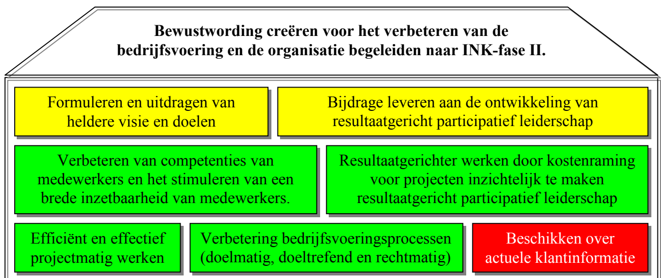
Figuur 2 Bouwtekening Kwaliteitsprogramma

Onderstaande bouwtekening geeft aan dat het overkoepelende doel wordt gerealiseerd met een zevental bouwstenen van de afzonderlijke projecten.