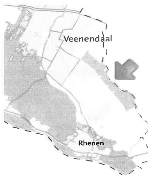
Afbeelding 1. Kaart RGW 21-1-2013

Zo staat het echter niet in de PRS-viewer.