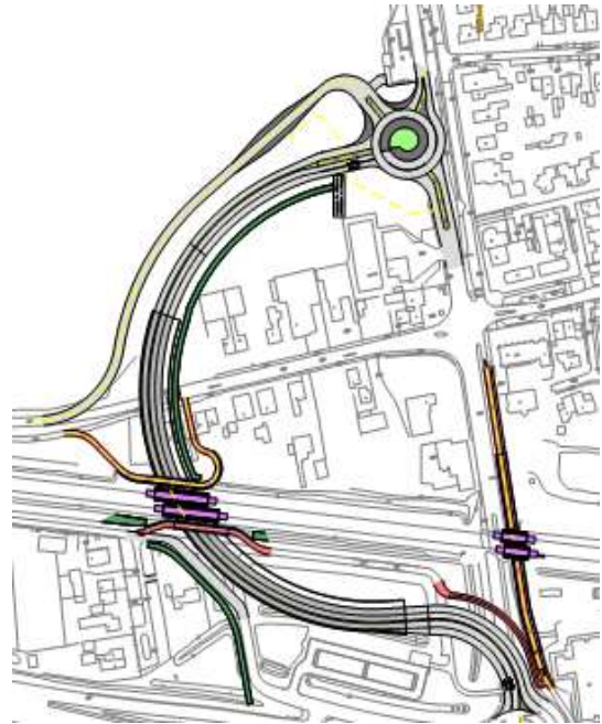
Figuur 2B Westelijke variant, Tuindorppweg afgesloten