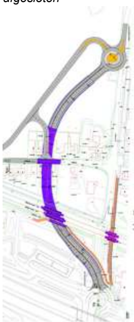
Figuur 3. Bos Beek variant

De Bos Beek variant volgt een westelijk tracé via de bedrijventerreinen van Bos en Van Beek. De tankstations Shell en Tinq zullen in dit ontwerp moeten verdwijnen van de bestaande locatie. De tunnelbak is daardoor langer dan de andere varianten en over een afstand van 150 meter overdekt. De overkapping is in paars weergegeven. Er is een "Bosweg" nodig om het verkeer van en naar Maarsbergen/Maarn via de noordelijke rotonde te verbinden met de onderdoorgang.