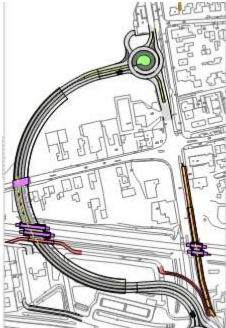
Figuur 2A Westelijke variant, Tuindorppweg open afgesloten

Er zijn twee westvarianten die een ruime boog om het kruispunt maken. Het verschil tussen deze beide Westvarianten is de manier waarop de Tuindorppweg wordt gekruist. De Tuindorppweg ligt lager dan het spoor. Om de bestaande verbinding Maarn-Maarsbergen in tact te houden, dient de onderdoorgang onder de Tuindorppweg door te gaan (figuur 2A). Vanwege de lage ligging van de Tuindorppweg wordt dit een relatief diepe en lange onderdoorgang. Wanneer de tunnelbak alleen onder het spoor doorgaat en daarna weer omhoog komt, wordt de Tuindorppweg afgesloten voor autoverkeer. Het fietsverkeer kan wel via de Tuindorppweg blijven rijden. In deze variant wordt een Bosweg aangelegd om het verkeer van/naar Maarn via de rotonde naar de N226 te leiden (figuur 2B).