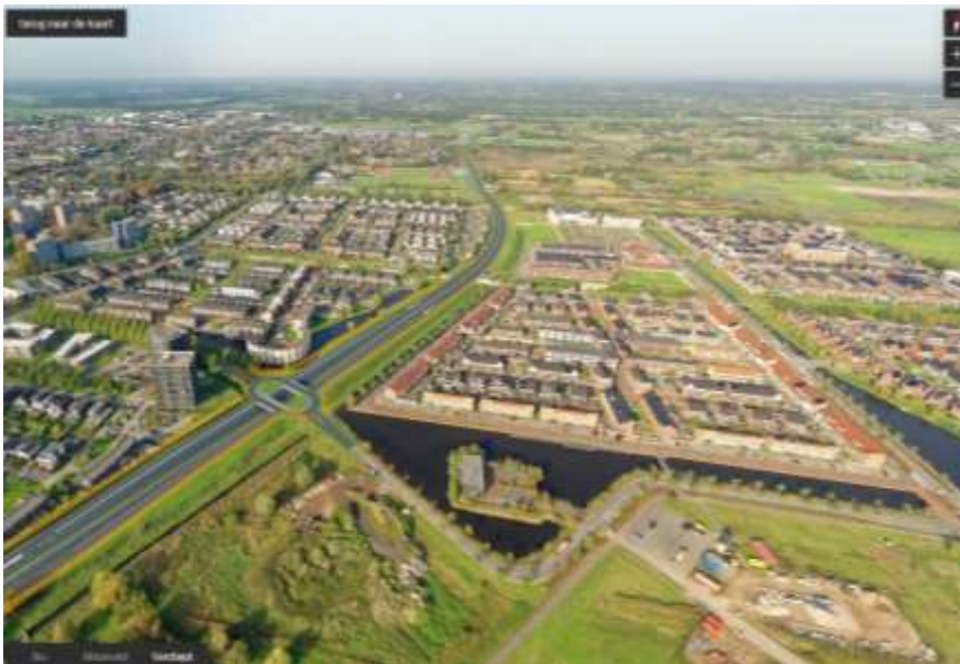
Afbeelding van de voorgestelde voorkeursvariant in vogelvlucht, noordelijk georiënteerd richting A12. Rechts van de N233 ligt de woningbouwlocatie Veenendaal-Oost.

We constateren dat er voor de maaiveld verbreding geen draagvlak is, daarom valt die variant af. Voor de variant waarbij beide kruisingen ongelijkvloers worden uitgevoerd zien we een forse extra investering (ca 20 mln) ten opzichte van de voorgestelde voorkeursvariant. Daar staat een heel beperkt positief effect in doorstroming tegenover. Voor de verbetering van de leefbaarheid heeft die toevoeging geen effect. Daarom valt deze variant af.