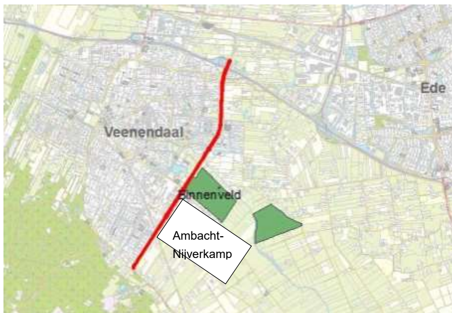
Figuur 2 Overzichtsk kaartje met trace N233, N2000 Binnenveld en industrieterrein AmbachtNijverkamp.

Momenteel loopt er een aanwijzingsprocedure voor het prioritair project industrieterrein Ambacht-Nijverkamp in Veenendaal, dat eventuele toekomstige groei van betreffende terrein mogelijk maakt. Deze aanvraag valt in de eerste PAS-periode (van 6 jaar) die loopt tot 2021. Een tweede periode heeft een looptijd tot 2027. Waarschijnlijk valt de vergunningverlening voor de Rondweg-Oost in de 3e periode die loopt tot 2033. In de regel wordt de aanvraag voor een prioritair project twee jaar voor de realisatie ingediend. Aangezien de realisatie van de te verbreden rondweg naar de huidige inzichten niet eerder dan over 10 jaar te verwachten is, valt er op dit moment nog geen inschatting te maken van ruimte of beperkingen die de PAS voor dit project in houdt. De consequentie van de vergunningverlening voor de uitbreidingen op het bedrijventerrein, indien deze de prioritaire status heeft verkregen, is dat er een beperktere daling van de stikstofdepositie op het Binnenveld zal plaats vinden. Indien deze verminderde daling leidt tot te weinig ontwikkelingsruimte voor de verbreding van de rondweg, dient bijsturing in de betreffende PAS-periode plaats te vinden. Dit kan bijvoorbeeld door het uitvoeren van extra bronmaatregelen. De realisatie van een te verbreden N233 is te ver in de toekomst gepland, waardoor het nu niet mogelijk is om hier een gerichte uitspraak over te kunnen doen.