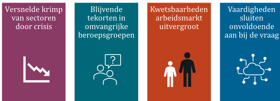
Figuur 1 Visuele weergave structurele ontwikkelingen Regio Utrecht (Beeld: Birch 2021)

De vier beschreven structurele ontwikkelingen op de regionale arbeidsmarkt vragen om aandacht voor het arbeidsfit houden van de beroepsbevolking en om de arbeidsmarkt in balans te krijgen en te houden. Delen van de regionale analyse komen overeen met de bevindingen en adviezen van de commissie Borstlap. 7 Deze commissie bracht zijn adviezen uit in januari 2020. Hun uitgangspunt luidt dat: "alle potentiële werkenden duurzaam actief blijven op arbeidsmarkt".