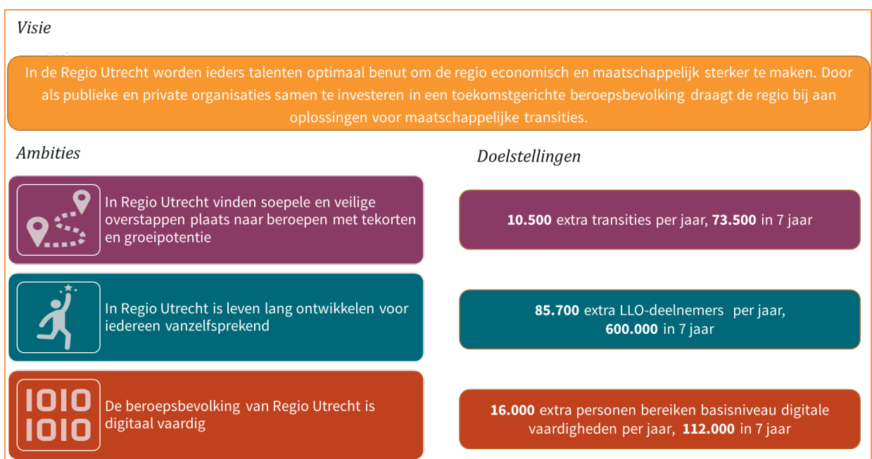
Figuur 2 Visuele weergave Visie, ambities en doelen HCA Regio Utrecht

Visueel samengevat zien de visie, ambities en doelstellingen van de HCA Regio Utrecht er als volgt uit: