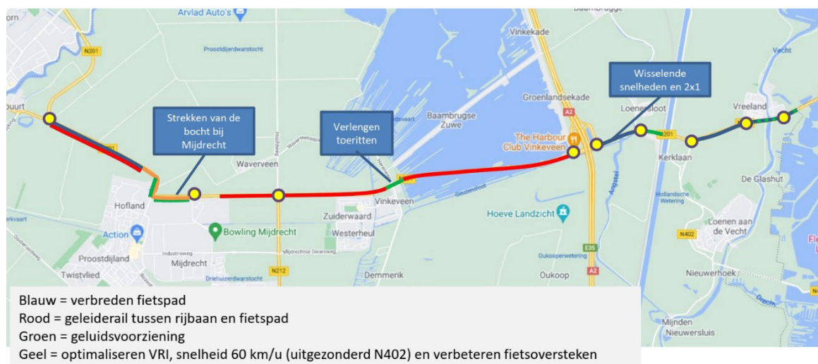
Figuur 3 Hoofdlijnen voorkeursalternatief fase 3

Het voorkeursalternatief op basis van de studie in fase 3 is op hoofdlijnen weergegeven in Figuur 3.