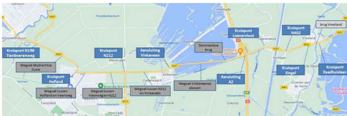
Figuur 2 Overzicht Knelpunten en wegvakken uit fase 3

In fase 3 is uitgegaan van dezelfde knelpunten en bouwstenen en is aanvullend gekeken naar eventuele problematiek op de wegvakken. Het totale overzicht van knelpunten staat hieronder in Figuur 2.