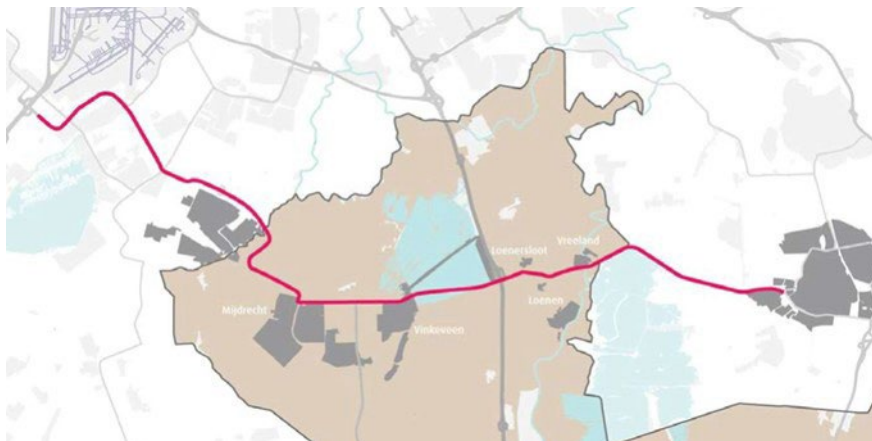
Figuur 1 Tracé N201 in de provincie Utrecht

Met dit statenvoorstel geven wij invulling aan deze opdracht en vragen wij u het voorkeursalternatief uit fase 3 met een uitvoeringskrediet van € 95.122.000 (excl. btw) te promoveren naar de voorbereidingsfase.