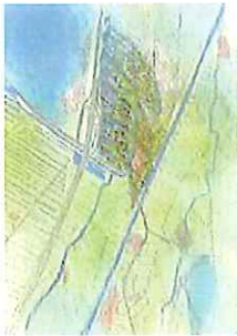
Schets variant Noord