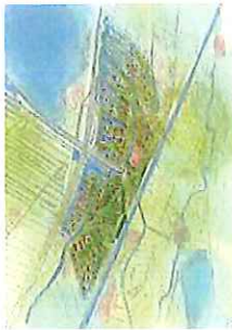
Schets varianten knooppunt N201 maximale uitbreiding Zuid en Noord