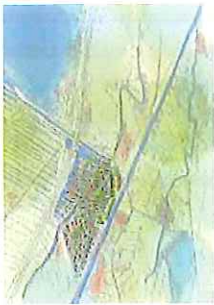
Schets variant Zuid