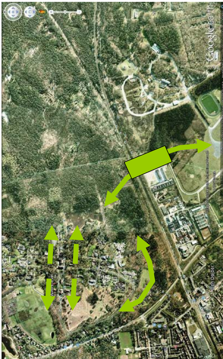
Fig.: Ecologische corridors WA-Hoeve