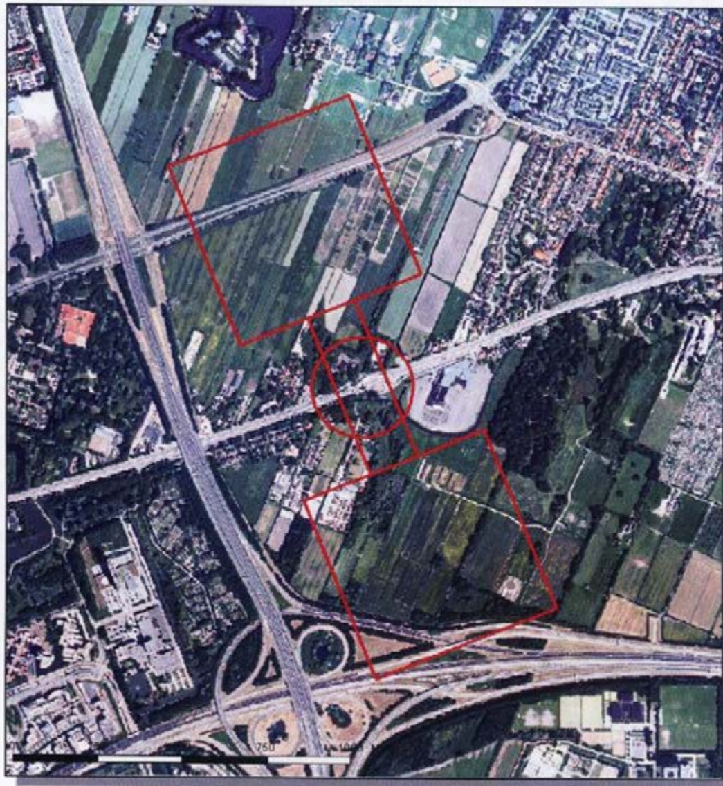
Figuur 3.2 Schematische weergave van het ruimtebeslag van de ecologische verbinding, de ecologische stapstenen en de bufferzone rondom de faunapassage. De rode contouren geven een indicatie van het optimale plaatje conform de hier gepresenteerde richtlijnen. In de verdere planvorming zal echter maatwerk moeten worden geleverd. Dit kan betekenen dat de feitelijke grenzen van de ecologische verbindingzone enigszins verschuiven ten opzichte van de contouren in dit plaatje en de grenzen naar verwachting ook minder strak van vorm zullen zijn.