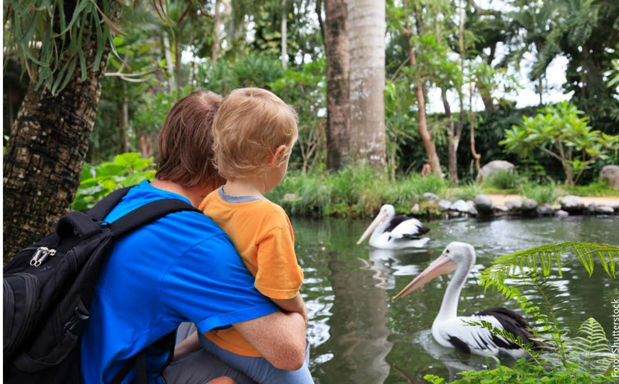
De RDA werkt op eigen initiatief aan een verkenning van de dierentuin van de toekomst

Zo heeft ook de adviesraad in Denemarken zich beziggehouden met dieren in sport en ontspanning. Waar de RDA een brede insteek koos, focust de Deense evenknie op één voorbeeld, namelijk de paardensport. De Denen stellen dat een paard geen atleet is en dat dit consequenties moet hebben