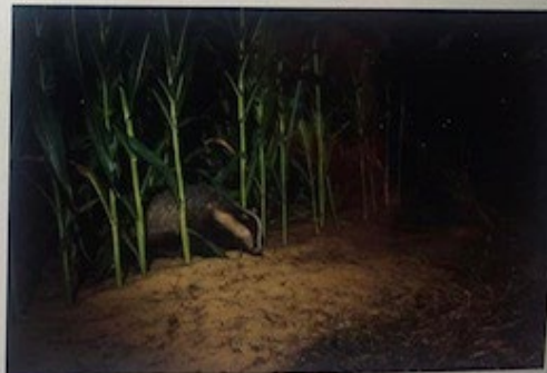
Schade aan een maisveld door een das

De nieuwe overeenkomsten gaan per 1 november 2023 in. Voor agrariërs kan dit betekenen dat men met een andere organisatie in contact komt dan voorheen. De overeenkomsten met de nieuwe taxatiebureaus zijn tot stand gekomen na een Europese aanbesteding begin 2023. De huidige taxatiebureaus Wiberg Taxaties en Van Ameyde Waarderingen blijven een deel van de faunaschade voor BIJ12 taxeren. Wie welke faunaschade gaat taxeren is hieronder te zien: