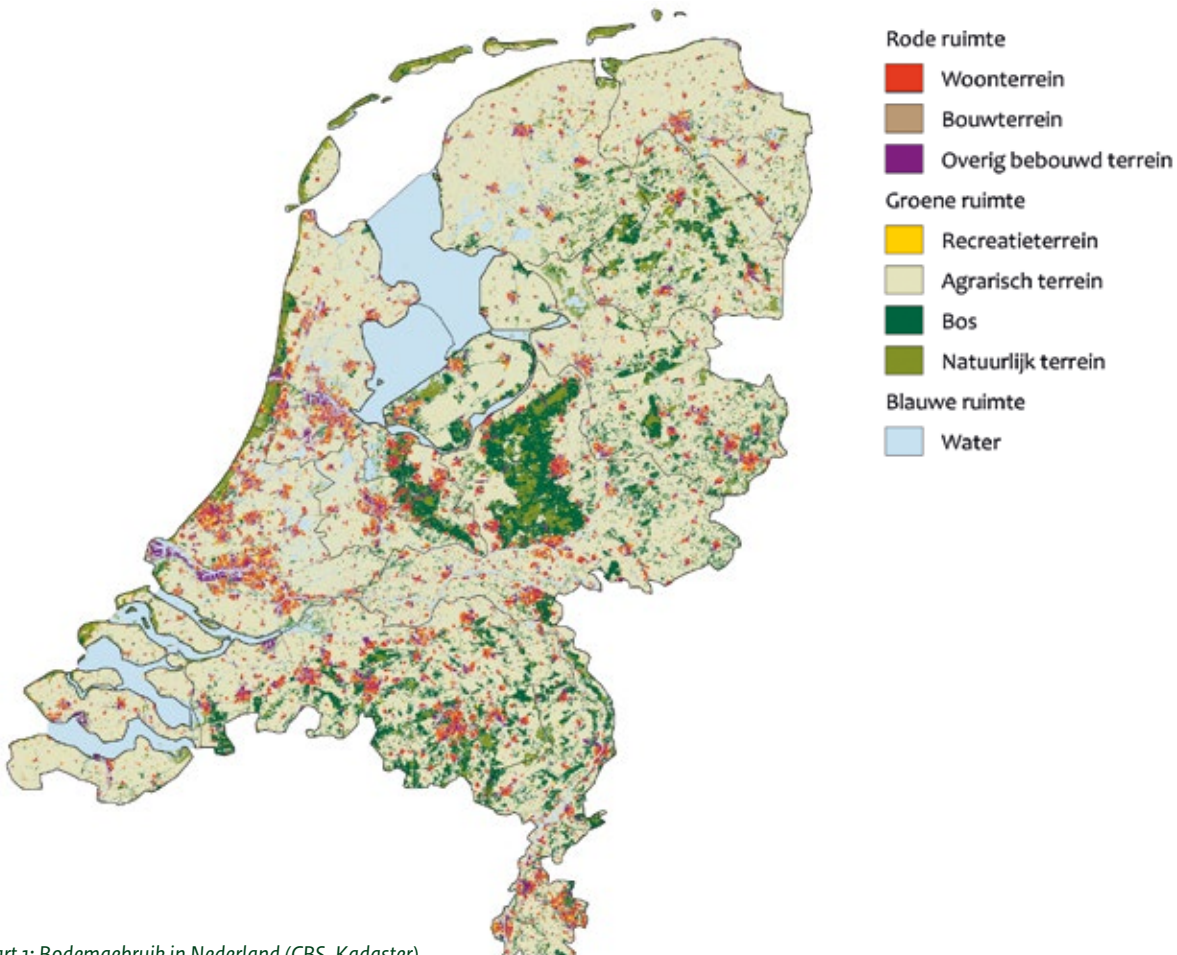
Kaart 1: Bodemgebruik in Nederland (CBS, Kadaster)

Maar soms moeten we andere keuzes maken, om bijvoorbeeld de veiligheid te borgen of om ruimte te creëren voor nieuwe woningen. In het reguliere beheer worden bomen gekapt voor verjonging en productie (zie het thema 'Vitaal bos'). Ook is het soms nodig om bos om te vormen naar andere typen natuur. Dat komt omdat het in Nederland slecht is gesteld met de plant- en diersoorten die afhankelijk zijn van open landschappen, zoals heide. Dit komt vooral door de hoge stikstofneerslag. We blijven daarom de herstelmaatregelen voor deze kwetsbare natuur uitvoeren.