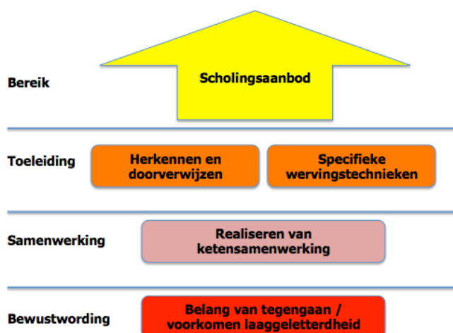
Figuur 2: Fasen in het tegengaan van laaggeletterdheid

Deze fasen zijn weergegeven in figuur 2.