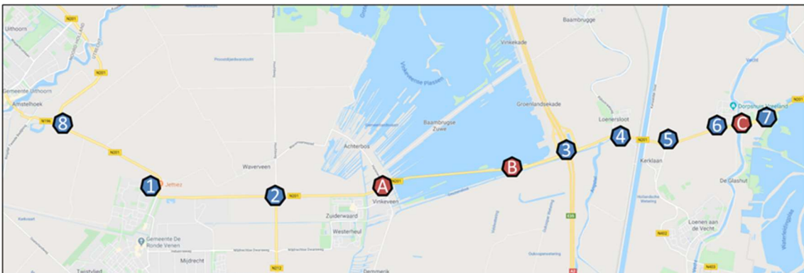
Afbeelding 1: Overzicht knelpunten en bouwstenen