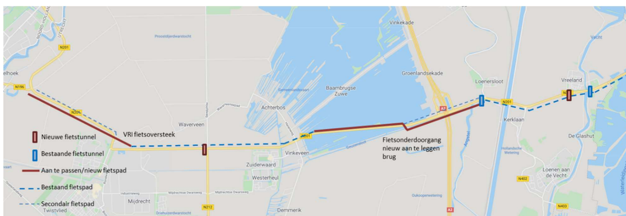
Afbeelding 2: traject vanaf Vreeland naar Amstelhoek (N196)

Voor het fietsverkeer is gekeken naar het huidige traject vanaf Vreeland naar Amstelhoek (N196) (zie bijlage 2). In de voorkeursvariant is reeds rekening gehouden met een aantal fietsmaatregelen die tevens de doorstroming ten goede komen (zie afbeelding 2).