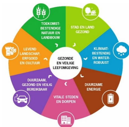
Afbeelding 2: De 7 samenhangende beleidsthema's, Omgevingsvisie Provincie Utrecht, 17 maart 2020

Een toelichting op de specifieke artikelen in de Wnb die betrekking hebben op soortenbescherming in de gebouwde omgeving en ruimtelijke ingrepen is te vinden in bijlage 1.