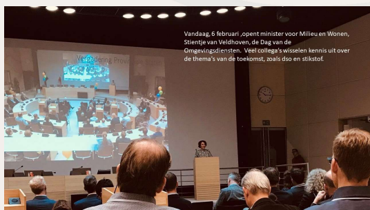
Vandaag, 6 februari, opent minister voor Milieu en Wonen, Stientje van Veldhoven, de Dag van de Omgevingsdiensten. Veel collega's wisselen kennis uit over de thema's van de toekomst, zoals dso en stikstof.

Een delegatie van de OD nam deel aan de eerste 'Dag van de Omgevingsdienst' in het Provinciehuis van Utrecht. Aan bod kwam: Modernisering VTH (inzet van data en focus op outcome); stikstof, circulariteit en klimaat; samenwerking tussen de omgevingsdiensten; Omgevingswet & Digitaal Stelsel Omgevingswet (DSO).