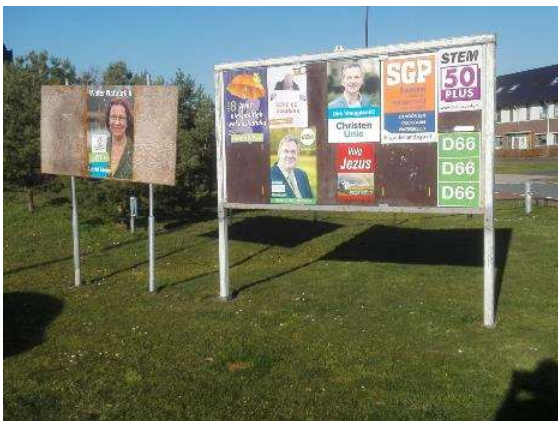
De poster van Water Natuurlijk in waterschap Vallei en Veluwe met lijsttrekker Astrid Meier hangt op een apart bord. De posters van de andere partijen groeperen zich rond die van de partij 'Volg Jezus'.