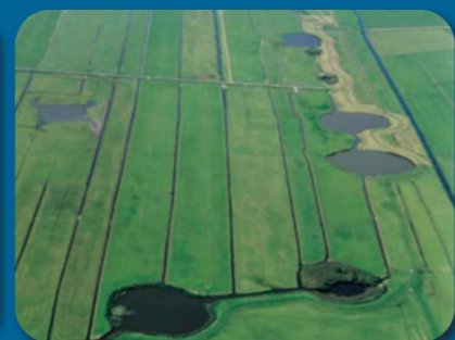
De Waaien, Eemnes