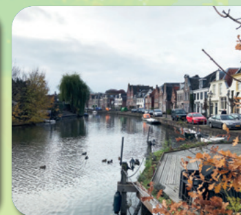
De Vecht, Maarsen