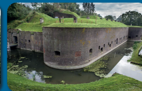
Waterliniemuseum Fort bij Vechten