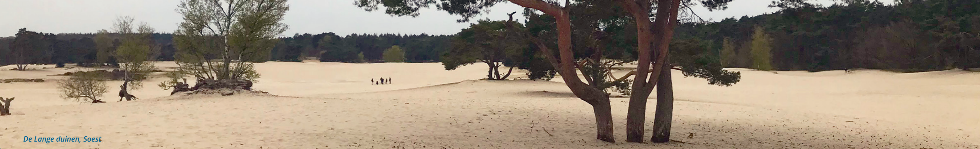
De Lange duinen, Soest