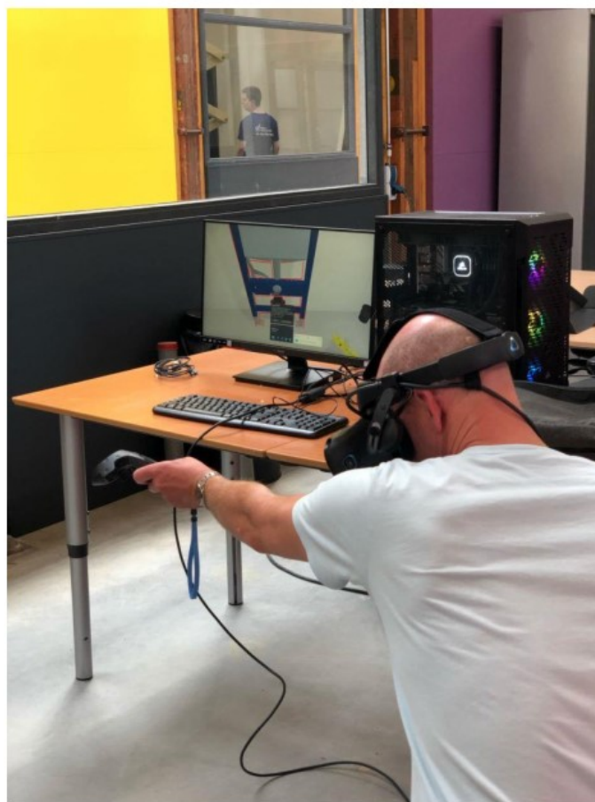
Figuur 1. Sanitair-installatiebedrijf Hoogendoorn BV ontwikkelde i.s.m. een lokale VR-ontwikkelaar en Wij Techniek een VR-omgeving voor het trainen van het plaatsen van een inbouwreservoir.

De toekenning van de MKB-Deal onderschrijft de steun van de provincie voor de TechnoHUB zijnde een manier om regionale en lokale initiatieven van provincies en gemeenten voor het zogeheten brede mkb te versterken. Naar aanleiding hiervan is er contact met de provincie Utrecht om te onderzoeken of en hoe er ook in de toekomst financiering voor (projecten in) de TechnoHUB plaats kan vinden, zodat de TechnoHUB een blijvende rol kan spelen in het uitkristalliseren en borgen van resultaten in genoemde beleidsdoelstellingen van de provincie. In dit document is uiteengezet hoe het agenderen van een structurele bijdrage voor het provinciale beleid voor de komende periode, het verschil kan maken voor initiatieven zoals de TechnoHUB, teneinde niet alleen te de meest urgente zaken van de bedrijven te kunnen adresseren, maar ook blijvende faciliteiten te kunnen scheppen die op lange termijn het verschil maken voor een sterk en veerkrachtig regionaal mkb.