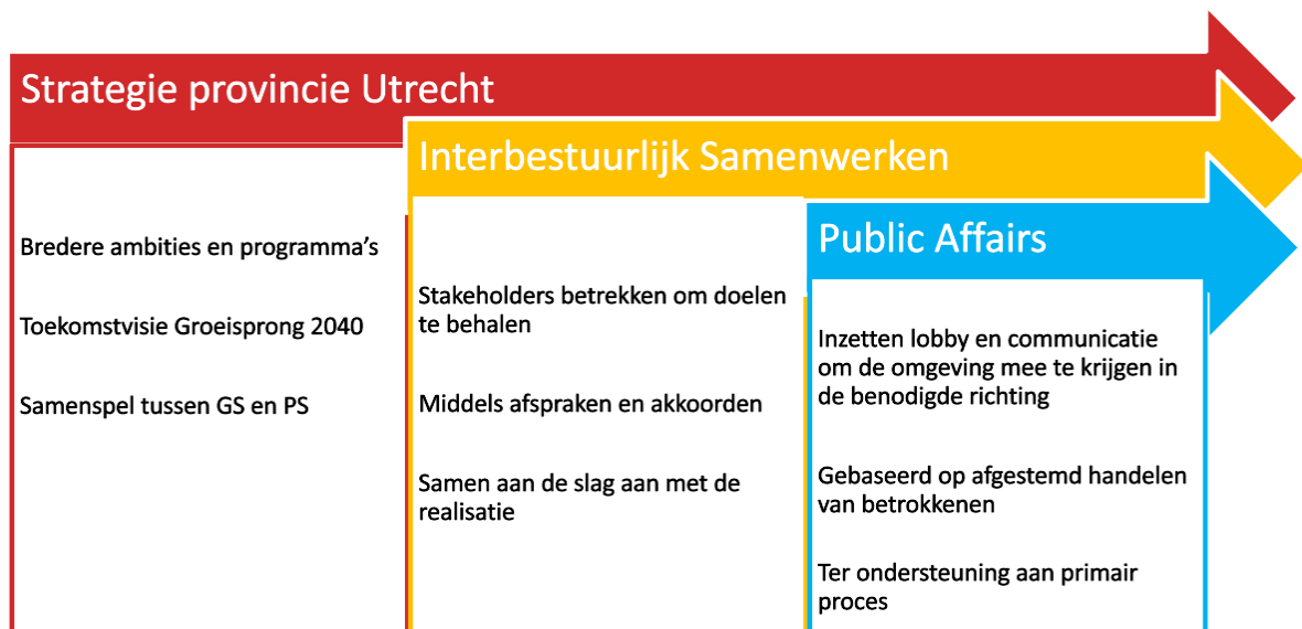
Figuur 1: public affairs in het bredere kader van de provincie Utrecht

Veelal hebben Rijk, de provincie en gemeenten een gedeelde opvatting over de opgaven en benodigde stappen die gezet moeten worden om deze opgaven aan te pakken. Het starten van een interbestuurlijk samenwerkingsproces is hiervoor afdoende. Het komt echter ook regelmatig voor dat er verschillen van inzicht zijn over het doel, of onenigheid over de te bewandelen weg om dit doel te behalen. Bij het aandienen van verschillen van inzichten over het aanpakken van één of meerdere opgaven, is public affairs behulpzaam om een verschil van inzicht met het Rijk toch te kunnen beslechten.