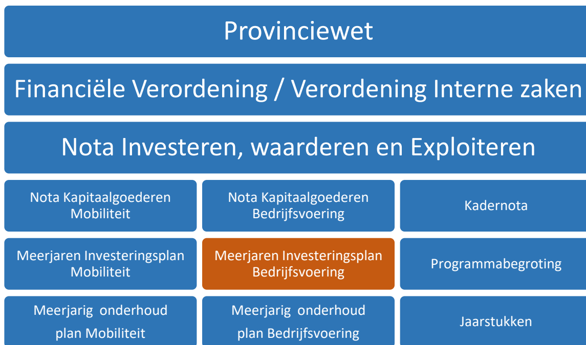
Figuur 1: Samenhang MIPB met wettelijke en provinciale kaders

Hierbij geeft de programmabegroting het financiële kader voor het lopende begrotingsjaar. Indien er verschillen optreden tussen de voornoemde nota's kapitaalgoederen, MIP's, MOP's en de (gewijzigde) programmabegroting dan geldt dat de Nota investeren een leidende rol heeft in de hiërarchie.