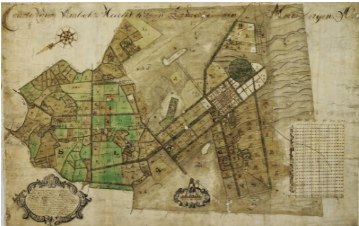
Anno 1716 (het Kombos is in het midden van deze kaart gelegen en te herkennen aan de rechthoekige structuur van het kooibos)

Blz. 34. Het Kombos is een oude bosgroeiplaats. Het gaat hier om bos rond de oude eendenkooi 'de Kom' die al in de 16 e eeuw in documenten wordt genoemd. Op een schilderij van het einde van de 17 e eeuw is ook te zien dat het Kombos toen reeds aanwezig was. Ook op kaarten uit de 18 e en 19 e eeuw is te zien dat het hier gaat om een oude bosgroeiplaats. Hierbij doen wij het verzoek om het Kombos toe te voegen aan de reeds beschreven oude bosgroeiplaatsen.