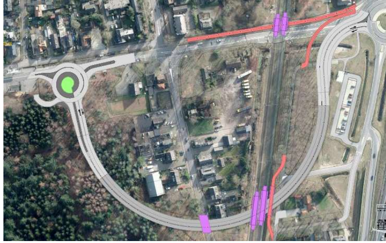
Westvariant met open Tuindorpweg

Er waren (naast Dorpsplan en Bos-Beek) twee Westvarianten waarvan er één gekozen is: