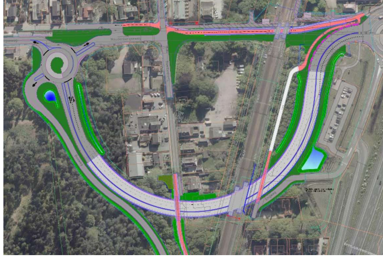
Westvariant met afgesloten Tuindorpweg