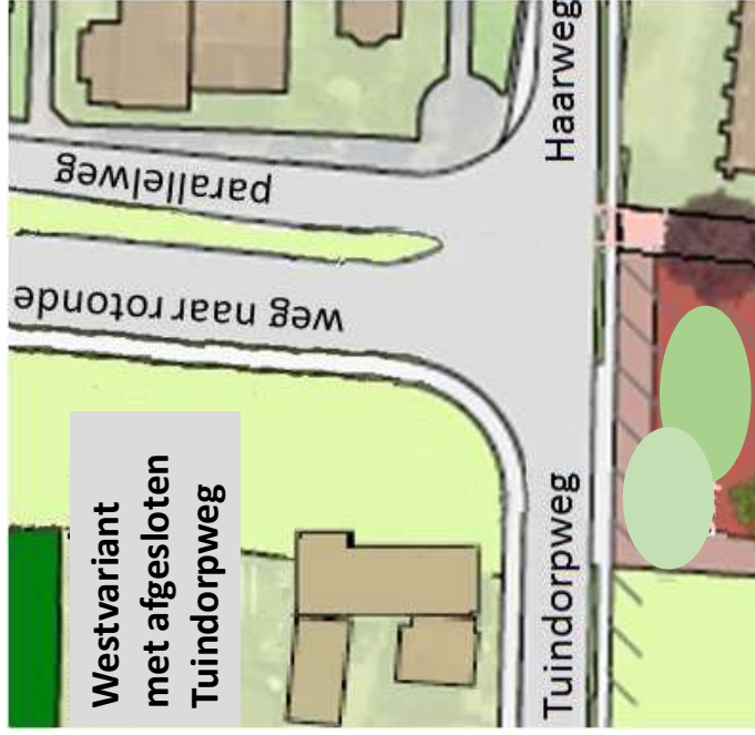
Westvariant met afgesloten Tuindorpweg