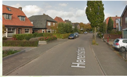
Kaart en impressie dorpskern Werkhoven