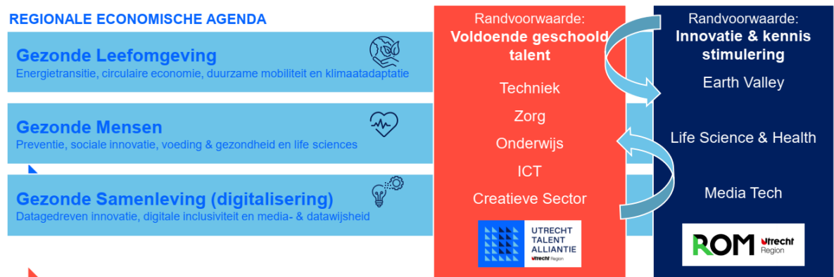
Figuur 1: Model regionaal ecosysteem in regio Utrecht (bijlage 1 bevat een tekstuele beschrijving van dit figuur)

De Regionale Economische Agenda (REA 2020-2027) richt zich op het oplossen van drie maatschappelijke vraagstukken die van invloed zijn op het welzijn en de welvaart van de inwoners van de regio Utrecht. De ROM Regio Utrecht stimuleert de ontwikkeling van innovatie en kennis voor het oplossen van deze vraagstukken. Via de inzet van de UTA investeert de regio in voldoende gekwalificeerd talent om deze transitie te kunnen realiseren. Deze context begint voor steeds meer partijen binnen en buiten de alliantie gemeengoed te worden. Zo worden doelen en financiering steeds meer afgestemd op de ambities van de UTA.